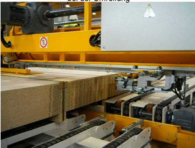
Eingeschobenes Kantholz vor Umreifung