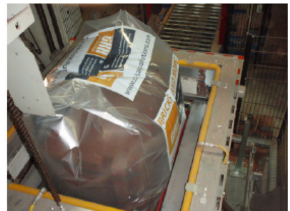
Beginn des Schrumpfvorgangs