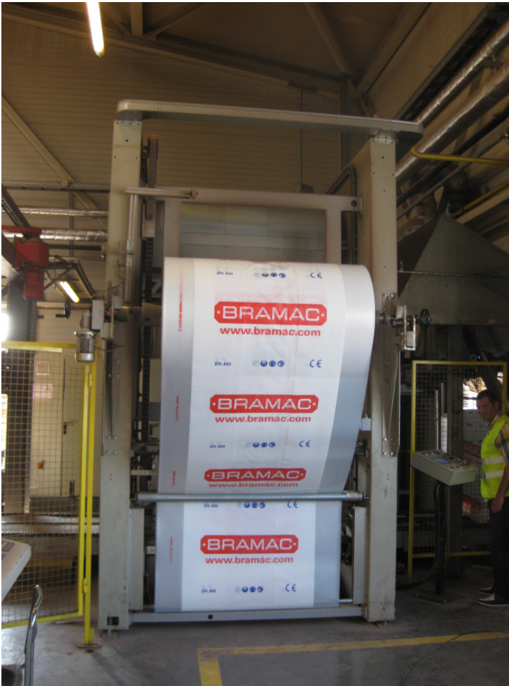
Der Haubenschrumper ersetzt eine Wickelmaschine. Das Paket besteht aus bereits umreiften Betondachsteinpakete.