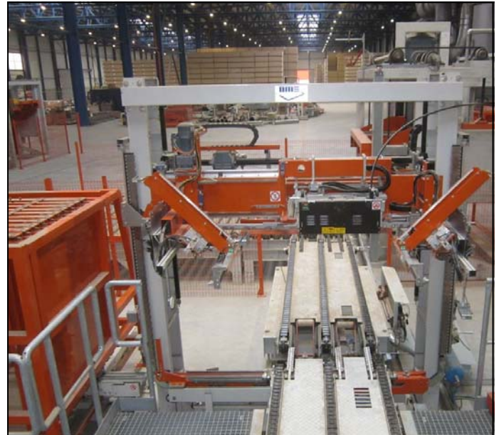
Umreifungsmaschine mit Winkelanleger