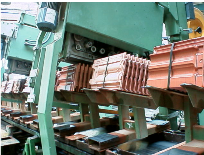
Vertikale Kleinpaketumreifung—2 Maschinen hintereinander für hohe Leistung